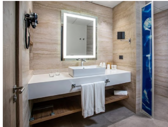
BestSerenade (Punta Cana, República Dominicana)