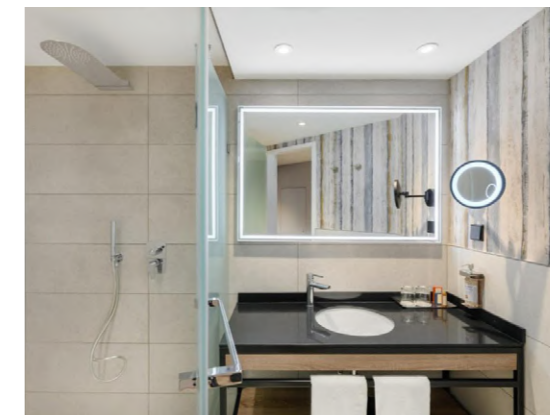
Danubius Helia (Budapest, Hungría)