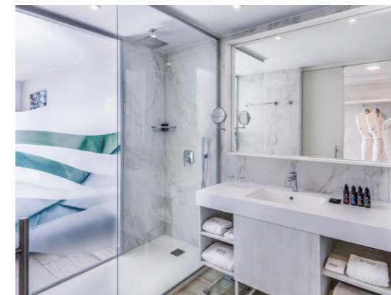
Melia Trinidad Península (Trinidad, Cuba)