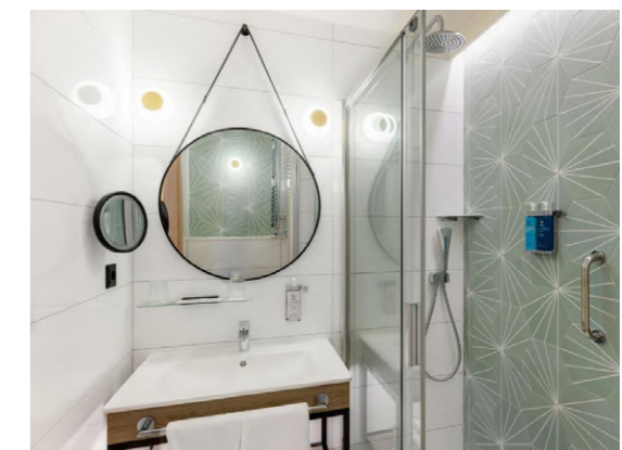
Esana Thermal Aqua (Heviz, Hungría)