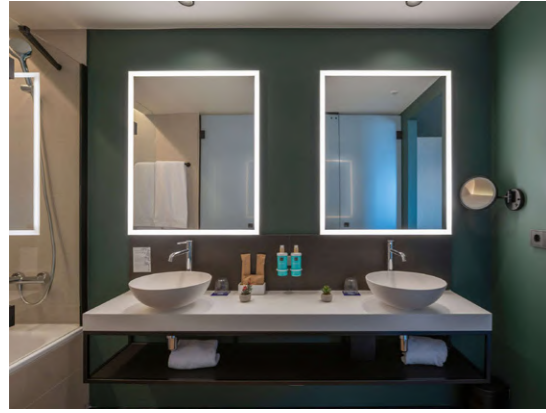
Novotel (Valencia, España)