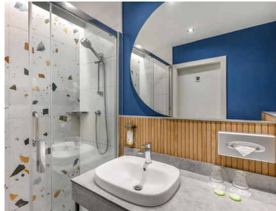
Danubius Anabella Balatonfured, Hungría