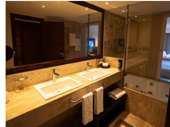
Grand Palladium Imbassai (Bahía, Brasil)