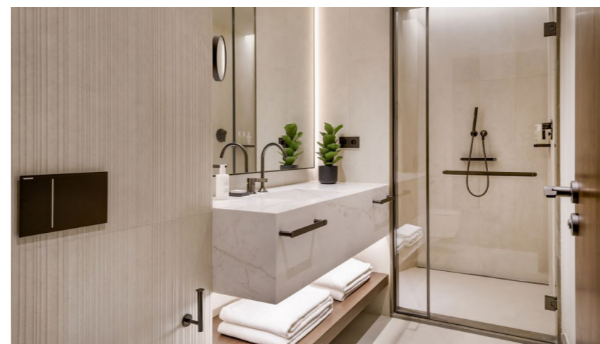
JW Marriot (Madrid, España)