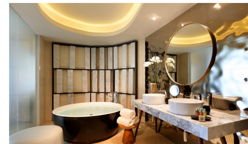
TRS Coral Hotel (Costa Mujeres, México)