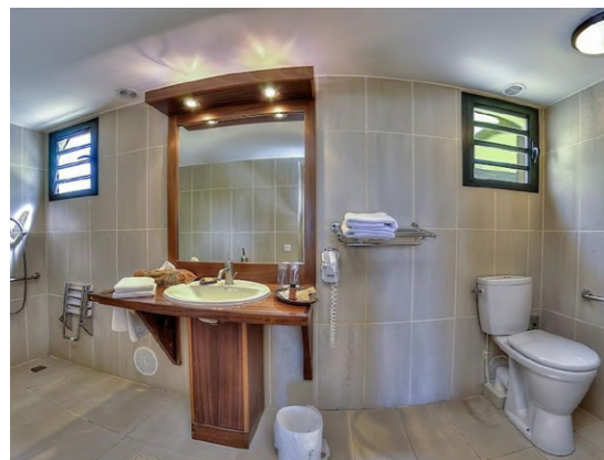
Hotel Le Dimitile Réunion, Francia