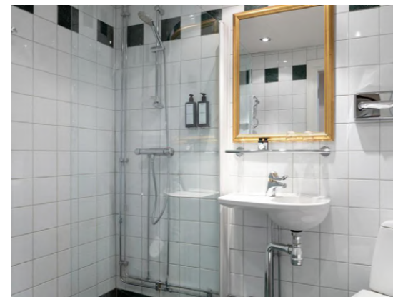
Elite Palace Estocolmo, Suecia