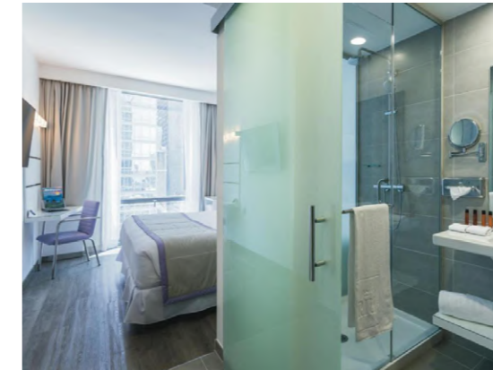
RIU Plaza New York Times Square (New York, EE.UU.)