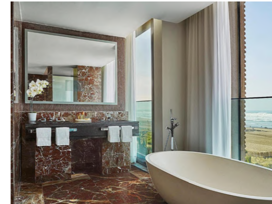
Four Seasons Casablanca (Casablanca, Marruecos)