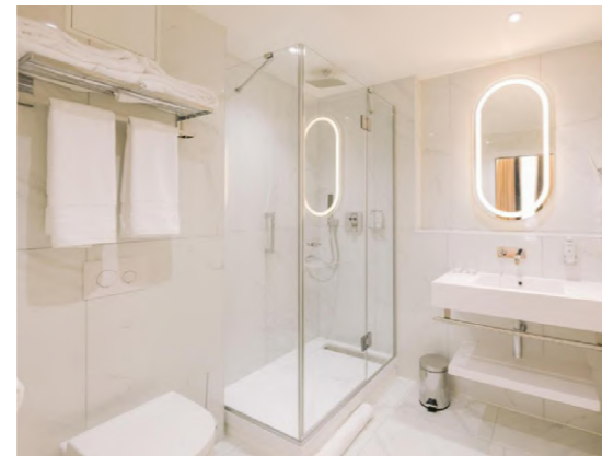
Hotel Majestic Burdeos, Francia