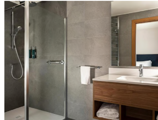
Hilton Garden Inn Padova Padua, Italia