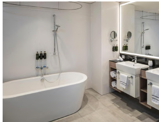
Melia Frankfurt Frankfurt, Alemania