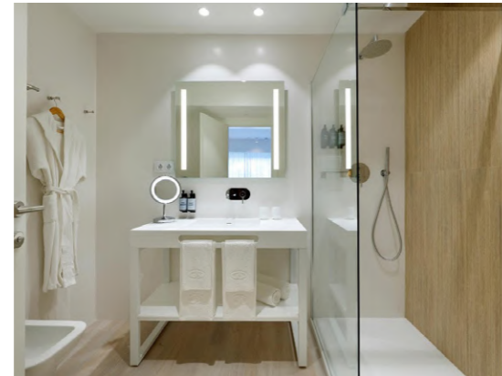
The Signature Level at Grand Palladium Sicilia (Sicilia, Italia)