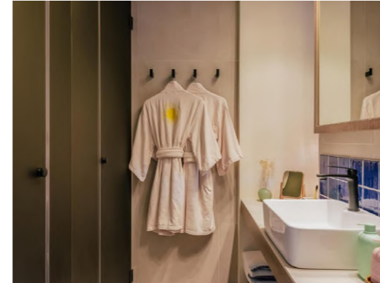
ZEL byMelía (Girona, España)