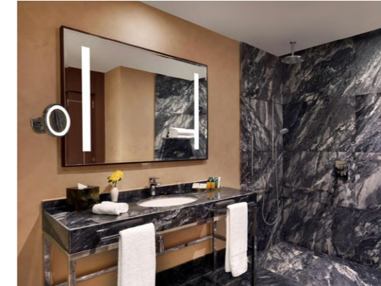
Hilton Garden Inn (Tanger, Marruecos)