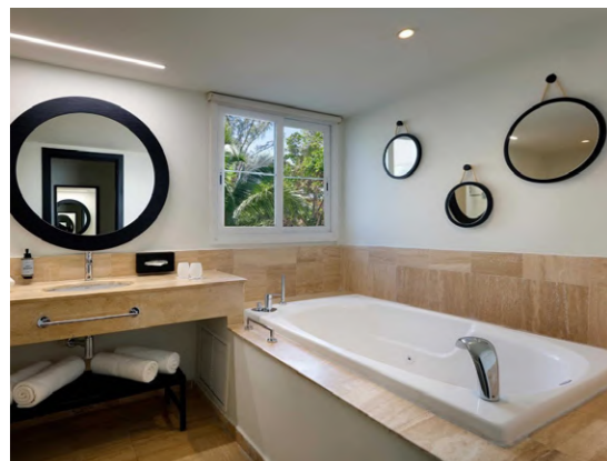
Grand Palladium Jamaica (Lucea, Jamaica)