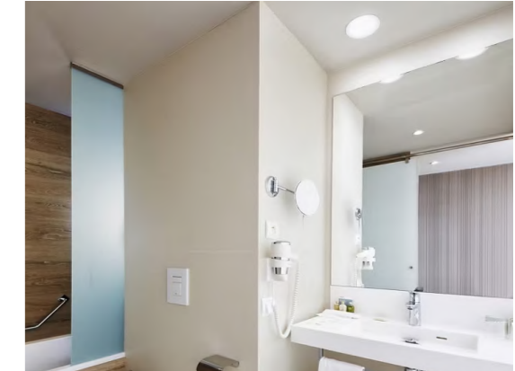
Barceló Praha (Praga, República Checa)