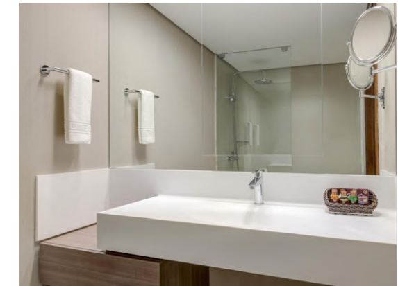
Wish Hotel da Bahia (Bahia, Brasil)