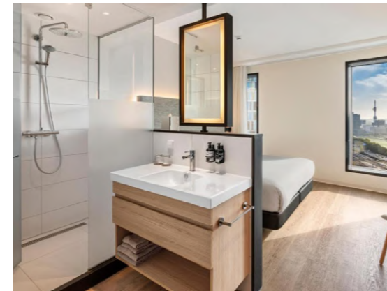
Melia Amsterdam Ámsterdam, Países Bajos