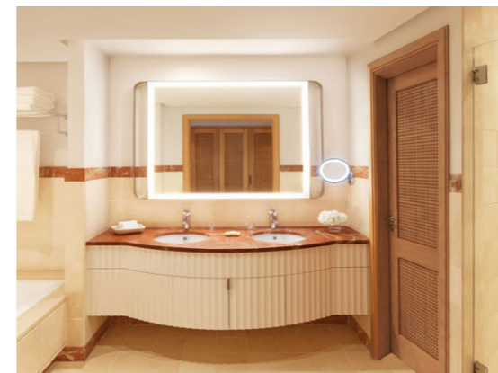
TheRitz-Carlton Tenerife, Abama (Tenerife, España)