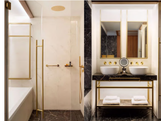
Radisson (Bilbao, España)