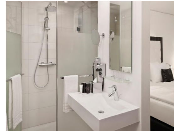
Melia Aachen Aachen, Alemania