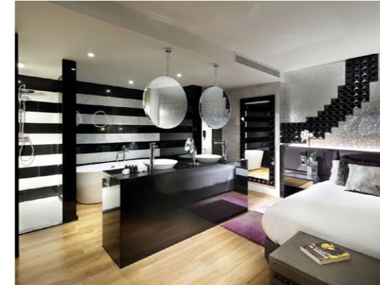
HardRock (Tenerife, España)