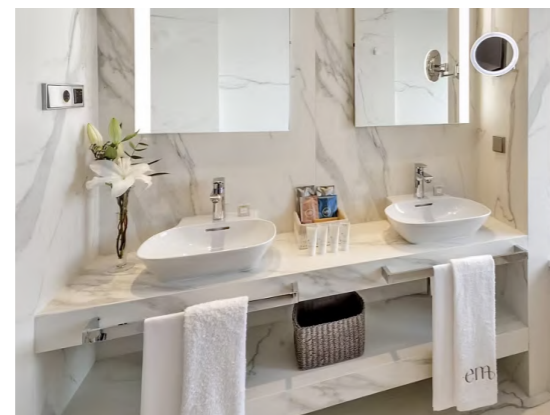
Barceló Emperatriz (Madrid, España)